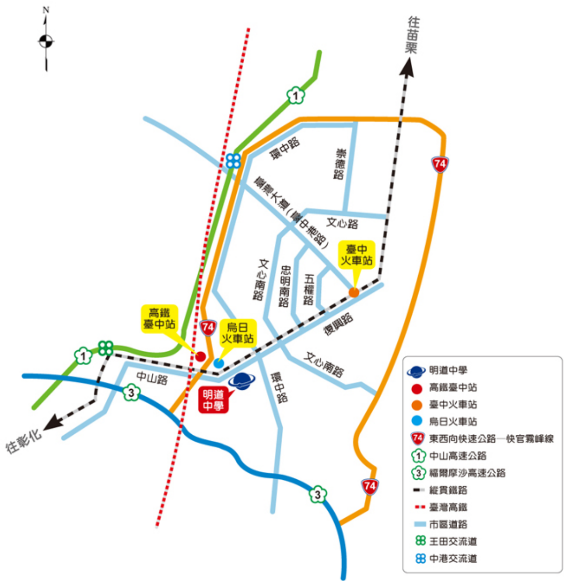
圖 3 明道中學地理位置圖